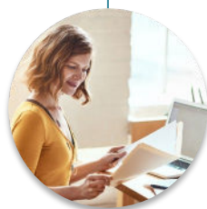
Formatrices formation théorique Relectrice des livrables de l'examen