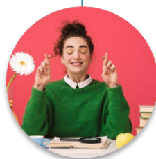
Responsable de session d'examen